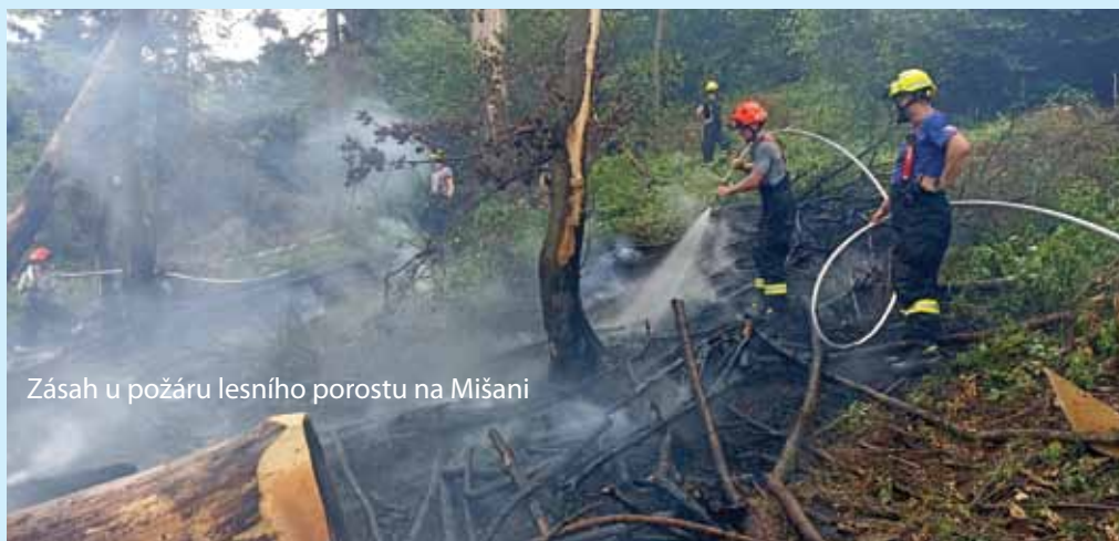
Zásah u požáru lesního porostu na Mišaňi

V pravé poledne 5. srpna byla naše jednotka povolána k požáru stavebního materiálu – polystyrenu v obci Šumice. Po příjezdu naší jednotky byl již požár uhašen místní dobrovolnou jednotkou ve spolupráci s HZS Uherský Brod. Za SDH kronikář Leoš Marek