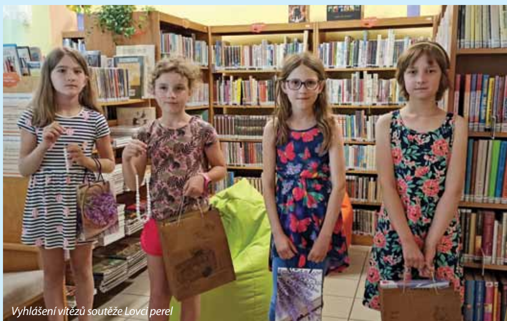
Vyhlášení vítězů soutěže Lovci perel

A co se dělo za zavřenými dveřmi knihovny v letním období? Dohánělo se vše, na co už nebyl v prvních měsících tohoto roku čas a prostor. A protože jednou z mých činností je již mnoho let i výkon regionálních služeb, poskytují knihovnám v okolních obcích Hostětín, Komňa, Pitín, Nezdenice, Rudice a Záhorovice regionální pomoc. Služby probíhají ve spolupráci s pověřenou knihovnou BBB v Uherském Hradišti a jsou poskytovány v rámci programu regionálních funkcí knihoven a financovány z rozpočtu Zlínského kraje. Na těchto knihovnách během roku vykonávám metodickou pomoc a poradenství. Mou prací je jednání nejen s knihovníky, ale i zástupci obcí, kontrola činnosti daných knihoven, pomoc při aktualizaci fondu (vyřazování knih), revizích, odpisech knih, zaučení nových knihovníků, proškolení v knihovním systému, pomoc při obalování knih, konzultace s knihovníky aj. Jednou ročně se v rámci těchto služeb koná v Uherském Hradišti a v Uherském Brodě setkání knihovníků veřejných knihoven regionu Uherské Hradiště. Toho letošního jsem se zúčastnila v Knihovně Františka Kožíka v Uherském Brodě ve středu 2. srpna