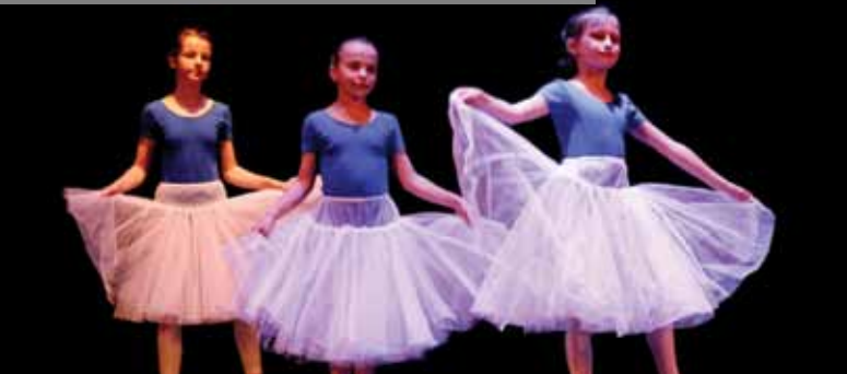
Tanec v srdci – celovečerní představení tanečního oboru ZUŠ Bojkovice, 16. 6. 2023