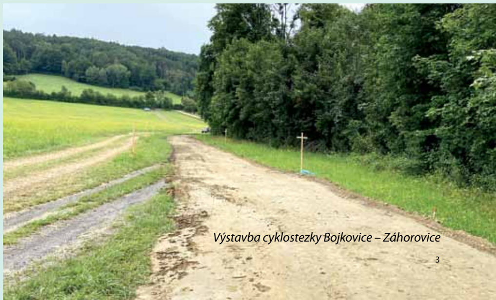
Výstavba cyklostezky Bojkovice – Záhorovice