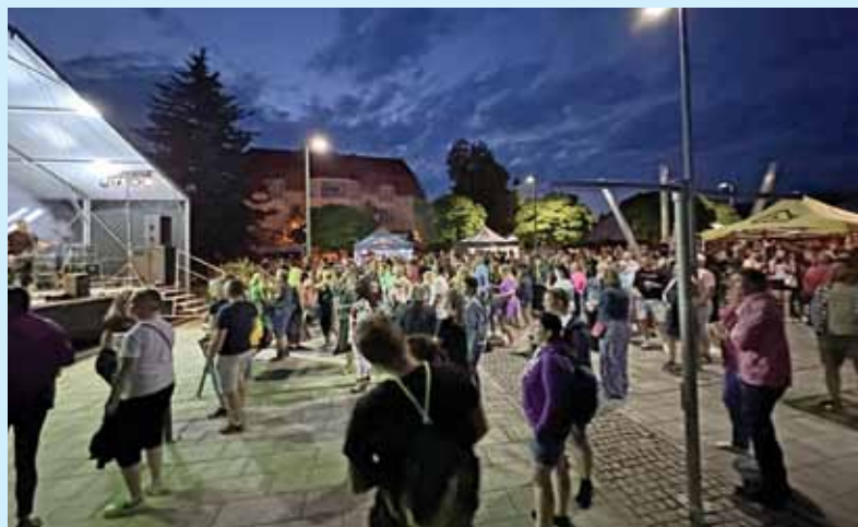
Pivní slavnosti – 22. 7. 2023