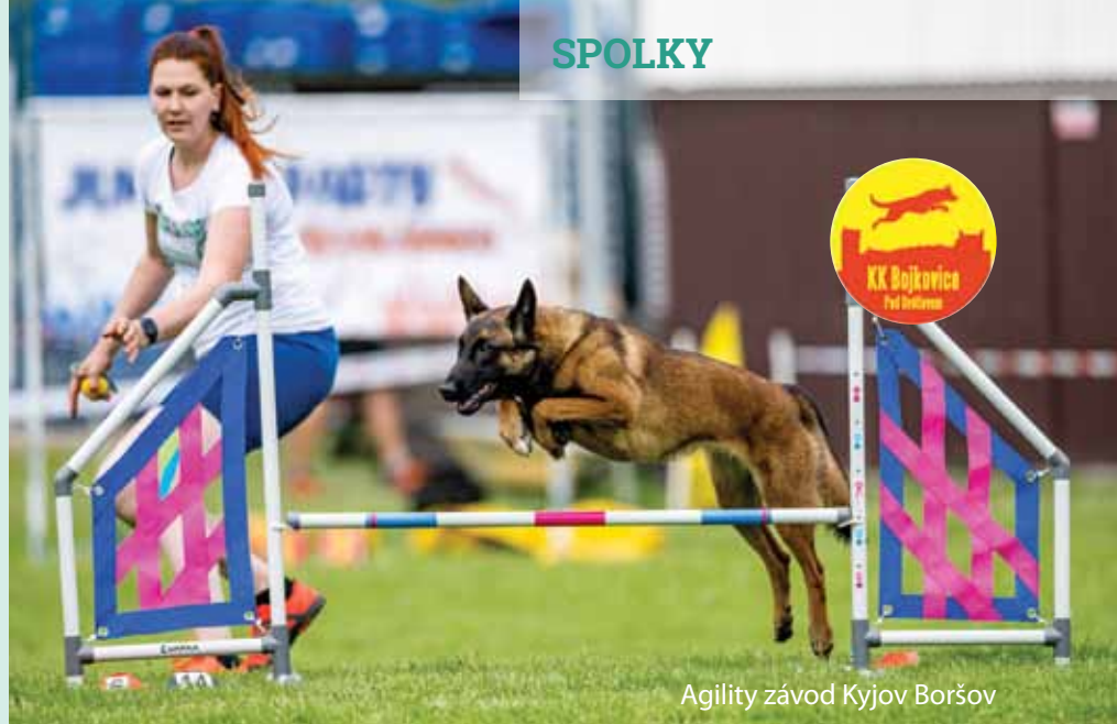
Agility závod Kyjov Boršov