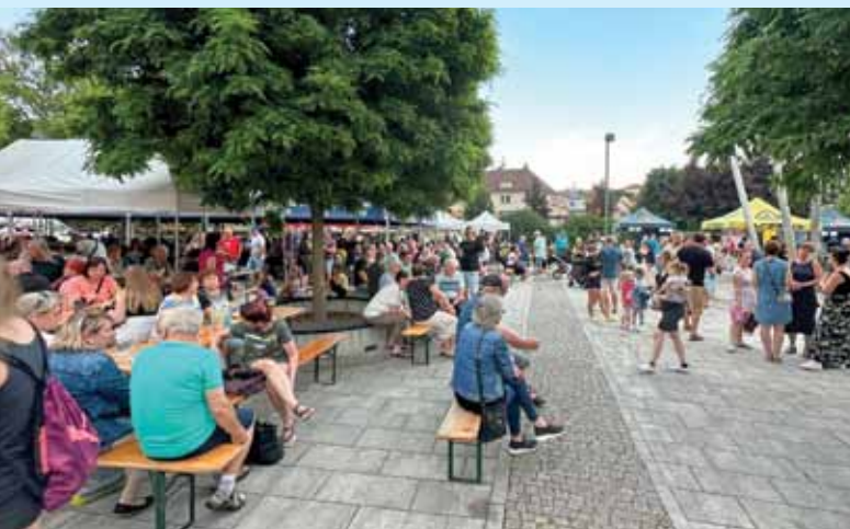
Pivní slavnosti – 22. 7. 2023