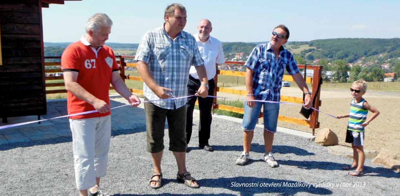
Slavnostní otevření Mazádkovy vyhlídky v roce 2013