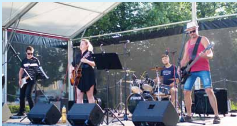
Svatovavřínecké hody v Bojkovicích – 11. - 13. 8. 2023