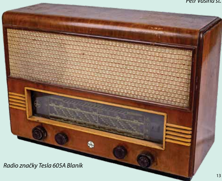
Radio značky Tesla 605A Blaník