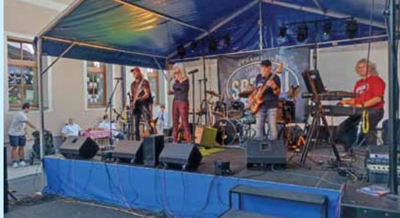
Svatovavřínecké hody v Bojkovicích – 11. - 13. 8. 2023

Folklorní soubor Světlovánek na Tillichově náměstí