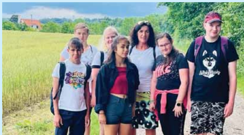
Předprázdninový čas – ZŠ Štefánikova 957 Bojkovice, 28. 6. 2023