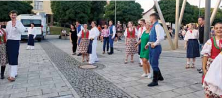
Svatovavřínecké hody v Bojkovicích – 11. - 13. 8. 2023

Folklorní soubor Světlovánek na Tillichově náměstí