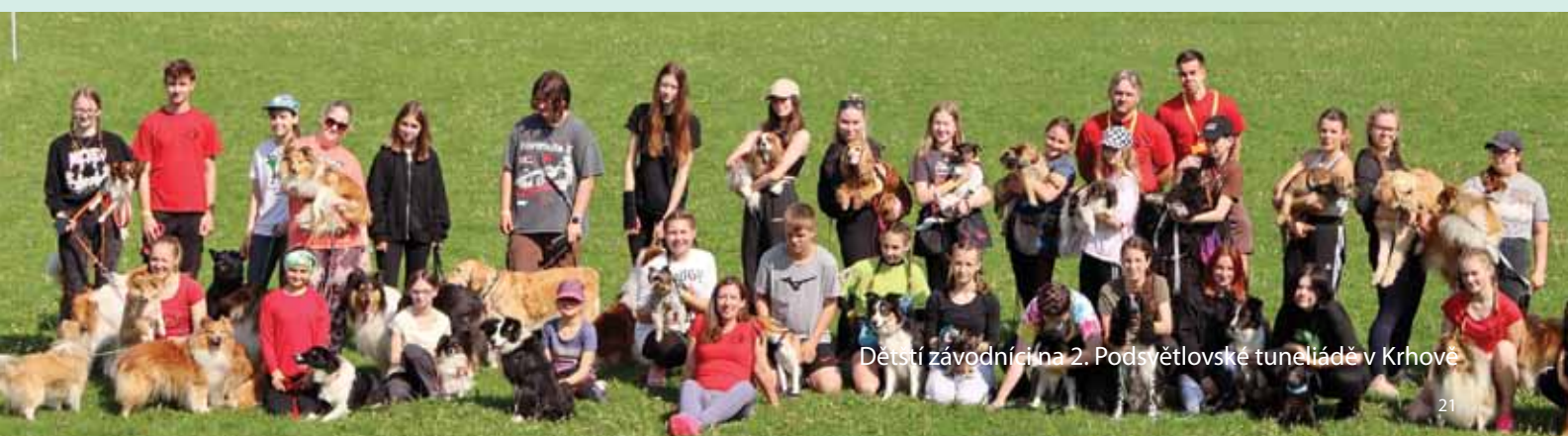
Dětsí závodníci na 2. Podsvětlovské tuneliádě v Krhově