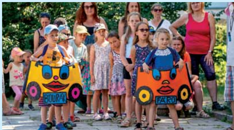
Všudybýlek 2023 – Dopravní hrátky Tillichovo náměstí, 9. 7. 2023