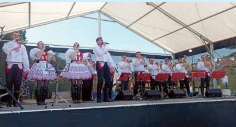
Svatovavřínecké hody v Bojkovicích – 11. - 13. 8. 2023

Sobotní hvězda večera – Speciál Věry Špinarové u hasičské zbrojnice