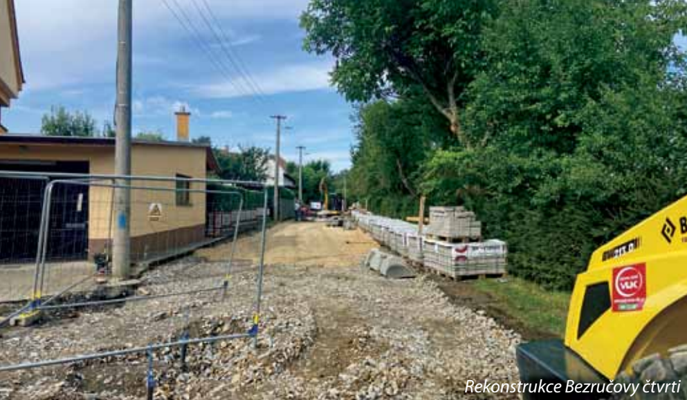
Rekonstrukce Bezručovy čtvrti