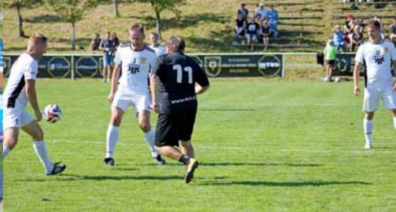
Oslava 90. výročí vzniku Sportovního klubu Slovácká Viktoria Bojkovice, 16. září 2023