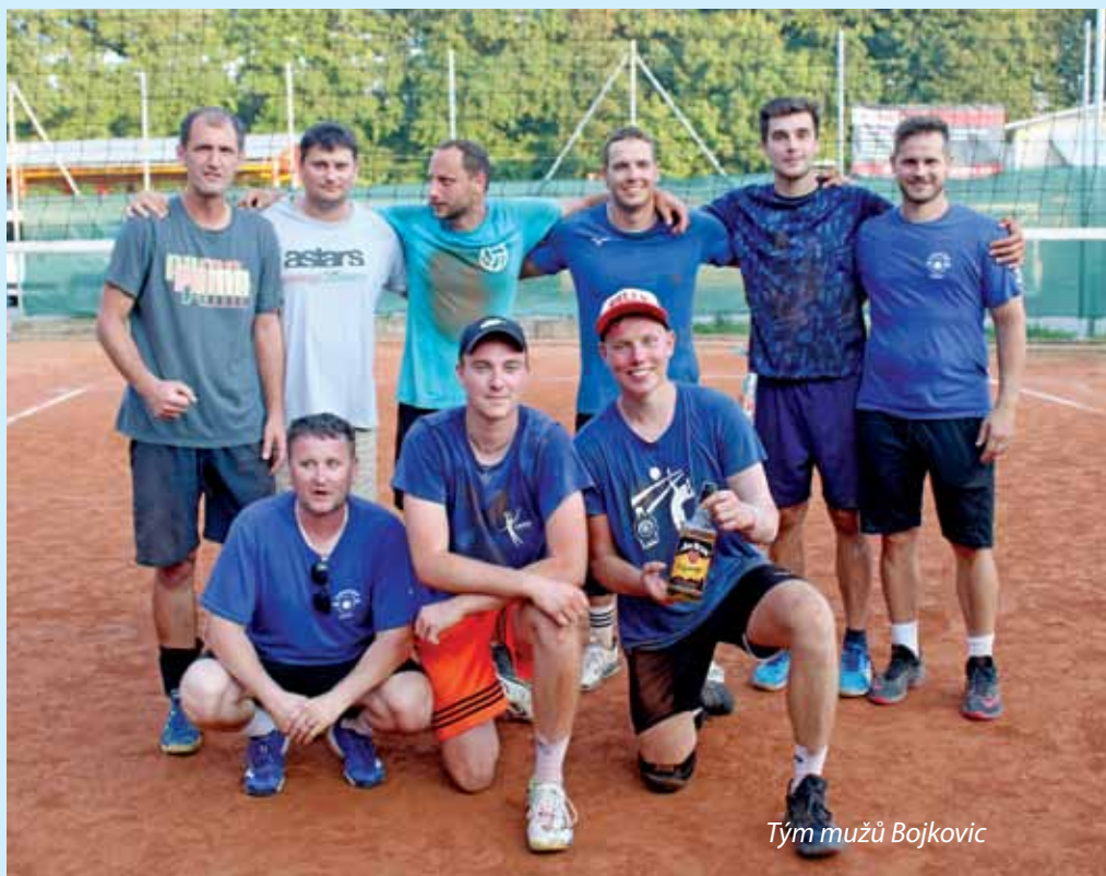
Tým mužů Bojkovic

Pořadí: 1. Modrá křídla, 2. Nostalgie, 3. Potomci mláďátek, 4. Cereální zabijáci