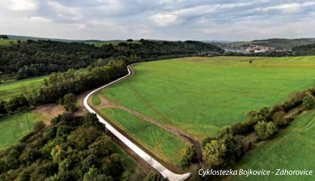
Cyklostezka Bojkovice - Záhorovice