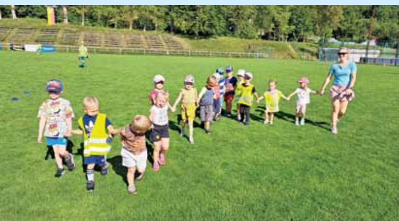
Akce mateřské školy