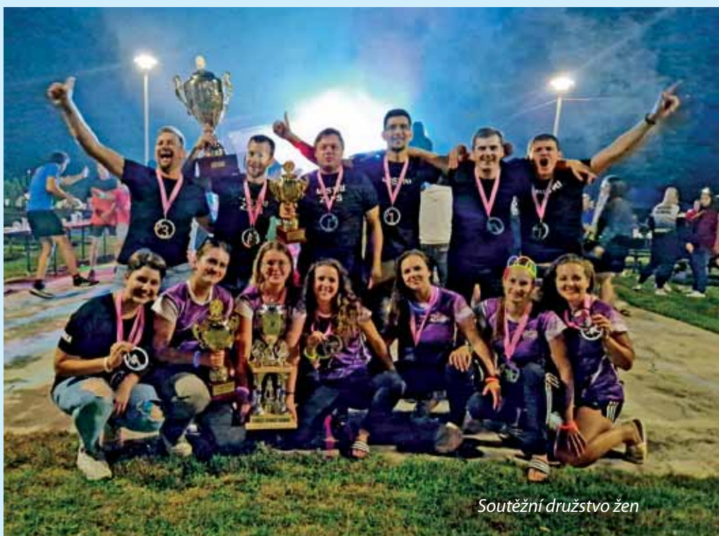
Soutěžní družstvo žen

22. září 2023 jsme se zúčastnili v Záhorovicích 4. ročníku dálkové dopravy vody pro mladé hasiče. Za pomoci našich cca 80 m hadic a PS12 jsme s ostatními sbory rozvinuli požární vedení o délce cca 480 m. Všichni zúčastnění na závěrečném nástupu dostali pamětní medaili, diplom a pochvalu, že zvládáme téměř to, co dospělí hasiči.