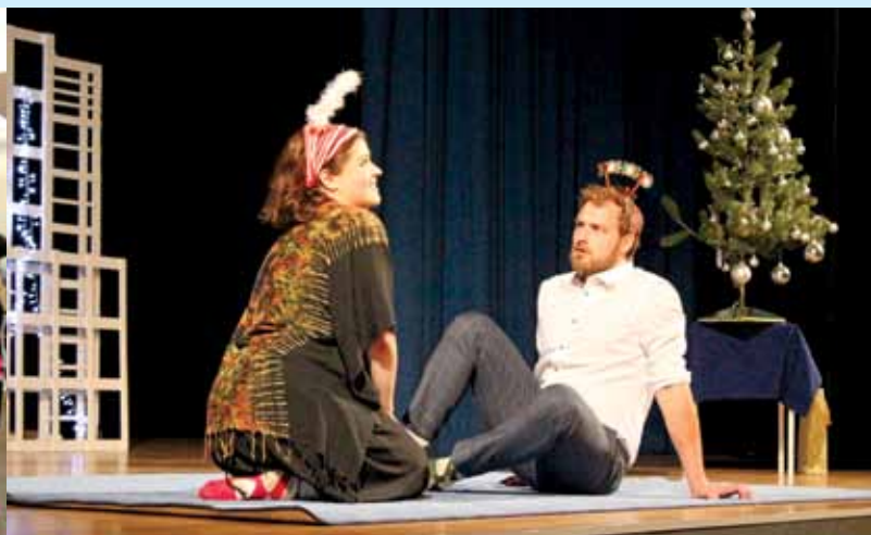
Když se zhasne – divadlo Dondi, 8.10.2023