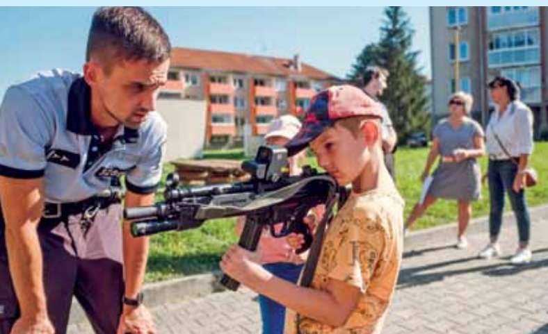
ZŠ Štefánikova 957 – Den otevřených dveří u SDH, 27. 9. 2023