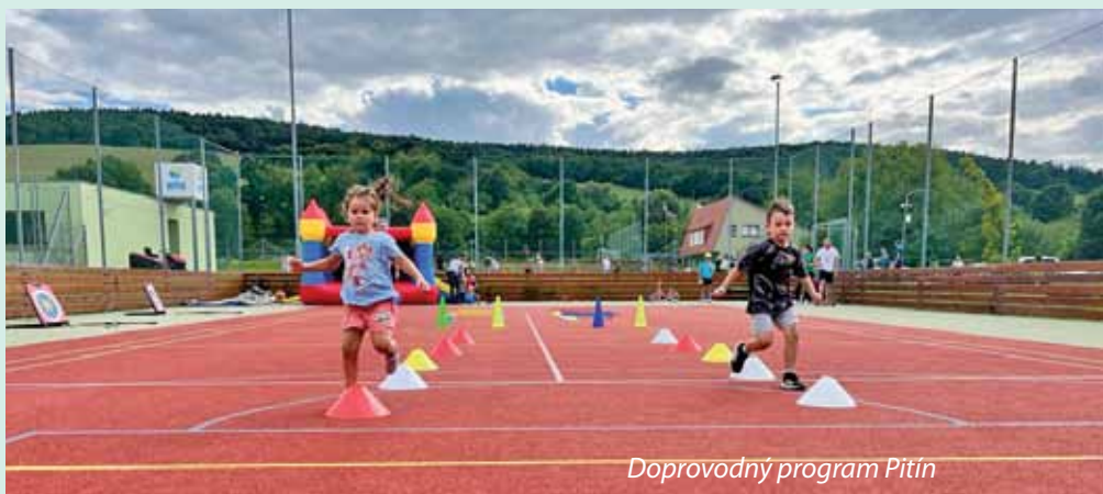
Doprovodný program Pitín

Tři dopoledne v týdnu ožije budova DDM programy pro maminky s dětmi. Večery zase patří cvičení dospěláků. V pondělí a ve středu je to bodyforming, power yoga, nebo zdravá záda. V úterý a pátek pak