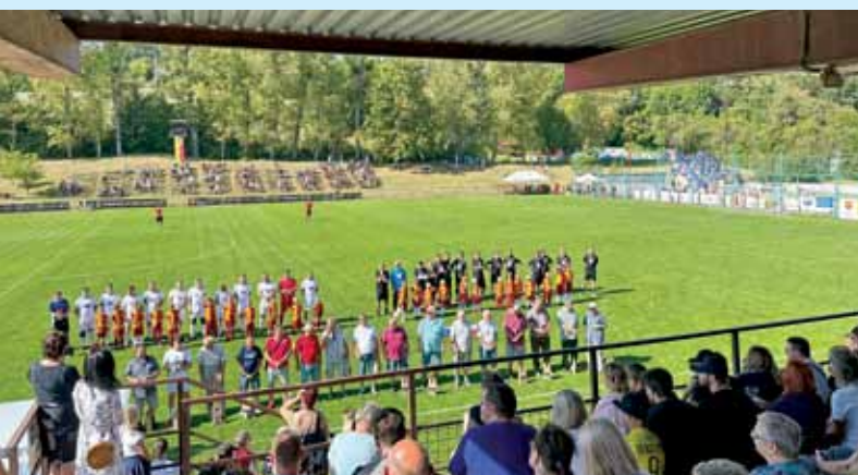
Oslava 90. výročí vzniku Sportovního klubu Slovácká Viktoria Bojkovice, 16. září 2023