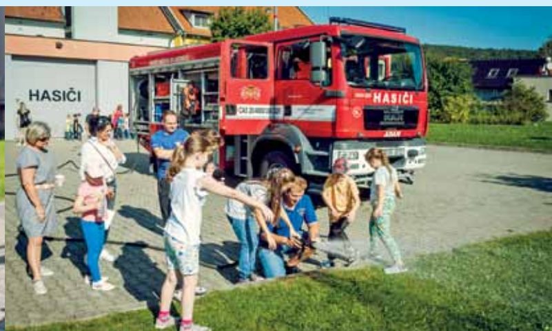
ZŠ Štefánikova 957 – Den otevřených dveří u SDH, 27. 9. 2023