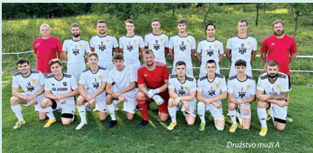
Družstvo mužů A