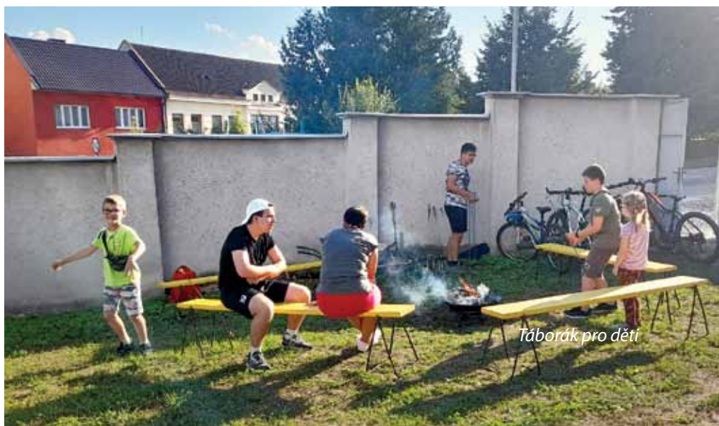
Táborák pro děti