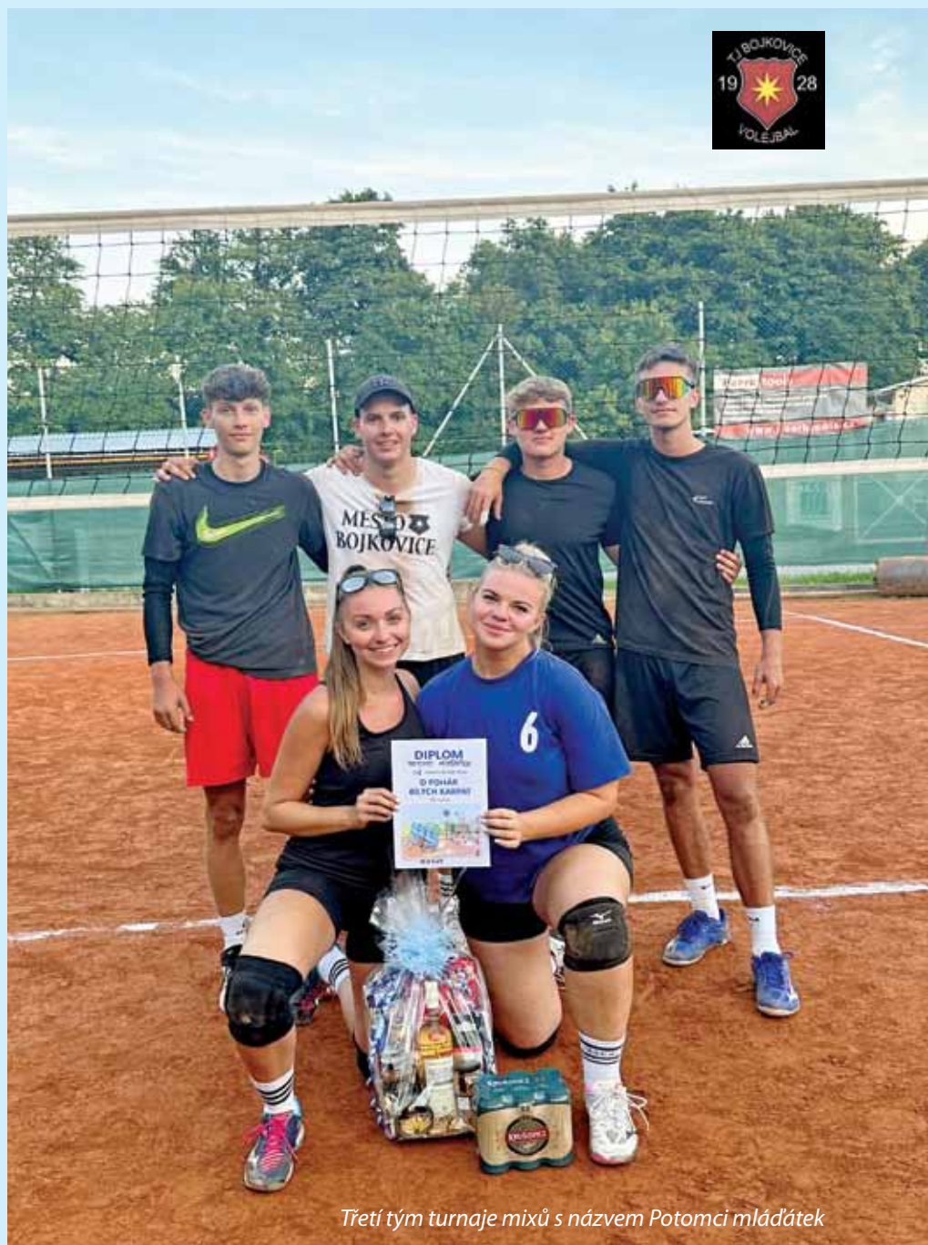
Třetí tým turnaje mixů s názvem Potomci mláďátek