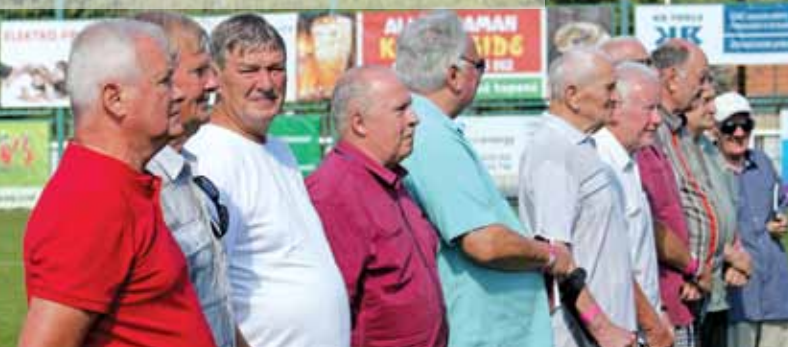
Oslava 90. výročí vzniku Sportovního klubu Slovácká Viktoria Bojkovice, 16. září 2023