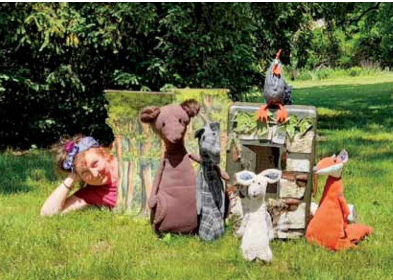
Pohádka O zajíčkovi, co byl rád na světě, 17. 9. 2023