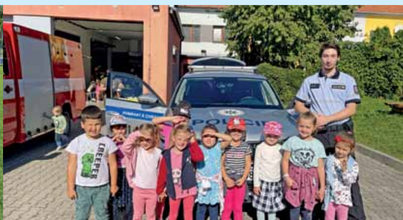
Akce mateřské školy