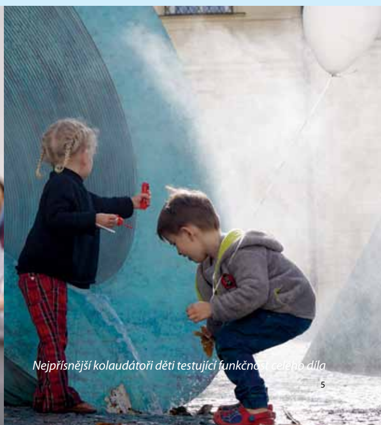
Nejpřísnější kolaudátoři děti testující funkčnost celého díla