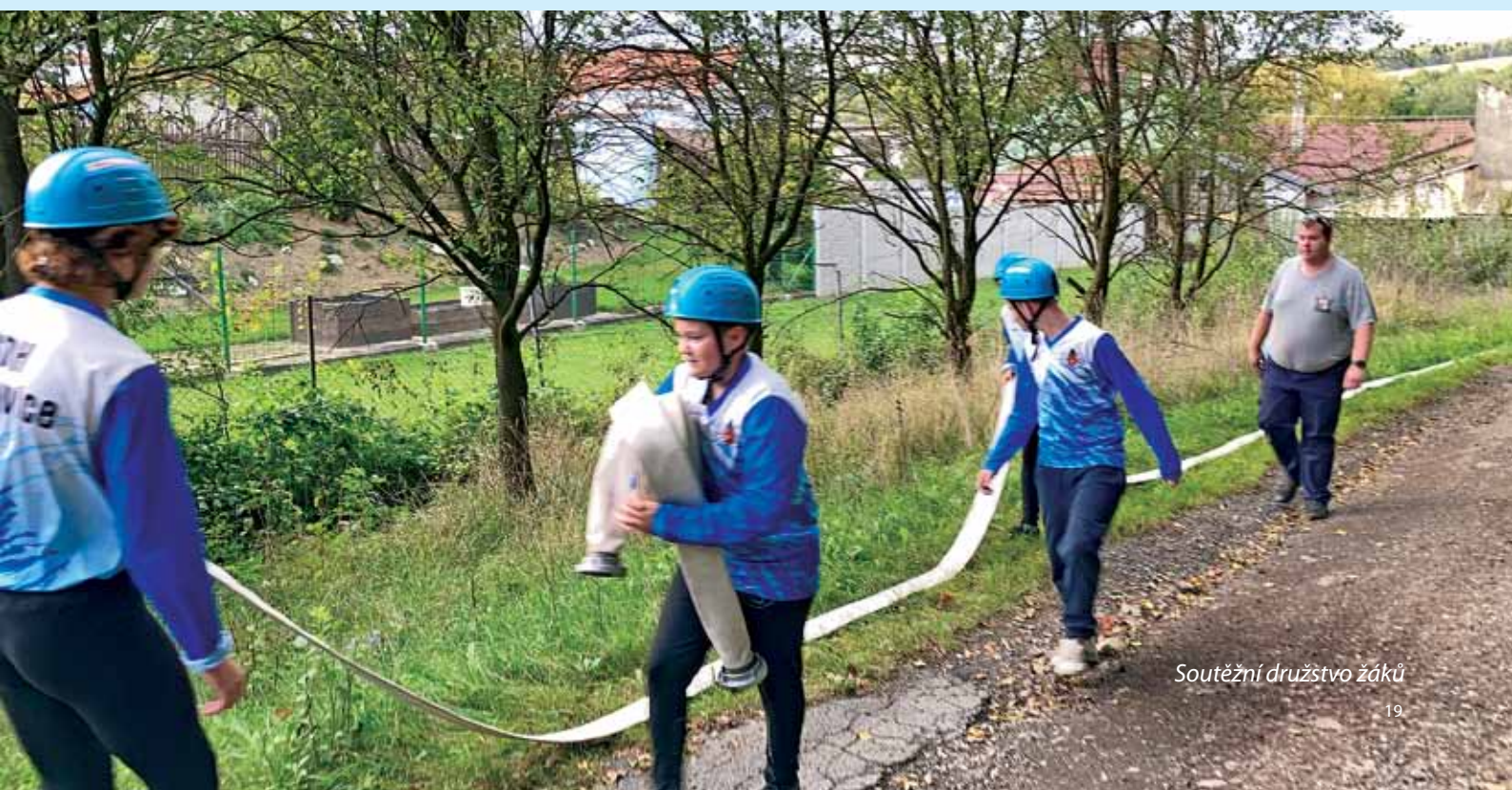
Soutěžní družstvo žáků