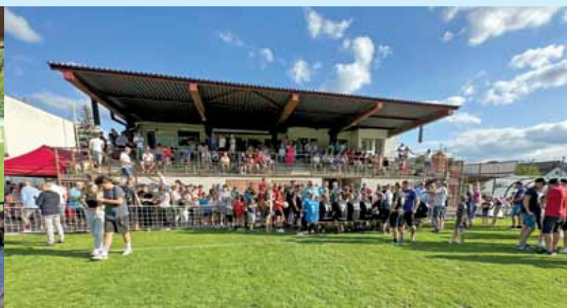
Oslava 90. výročí vzniku Sportovního klubu Slovácká Viktoria Bojkovice, 16. září 2023