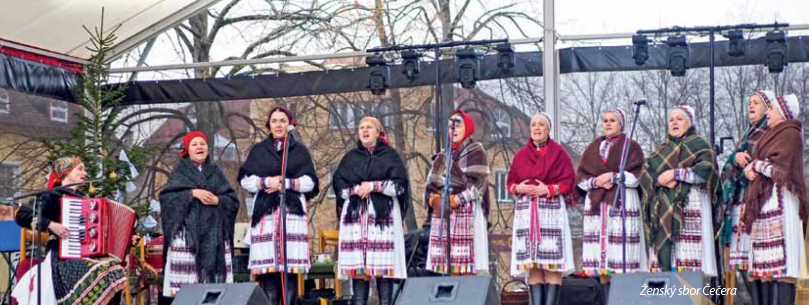
Ženský sbor Čečera

Opět po roce ožilo 15. – 16. prosince 2023 Tillichovo náměstí bojkovským vánočním jarmarkem. V pátek jej zahájila dechová hudba Bojkovice, kterou vystřídala dětská dechová hudba Horalenka společně s dětským pěveckým sborem Tulipán ze ZUŠ Bojkovice. S vánočním pásmem se představily také děti z dětského domova a děti z kroužků DDM Bojkovice. Jako každý rok mohli ti nejmenší využít tvůrčí Ježíškovu dílničku na DDM. Na jarmarku nesměl chybět ani FS Světlovan a Malý Světlovan s cimbálovkou J. Pavlíka a mužským pěveckým sborem Vavřineček. Večer pak všechny roztančila kapela Get Lucky. O občerstvení během celého podvečera se starali bojkovští hokejisté.