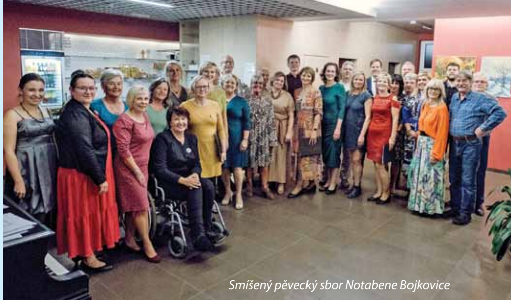
Směšený pěvecký sbor Notabene Bojkovice