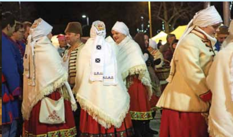
Vánoční jarmark – 15. - 16. 12. 2023