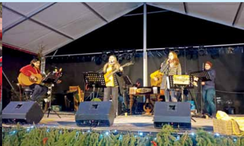
Vánoční jarmark – 15. - 16. 12. 2023