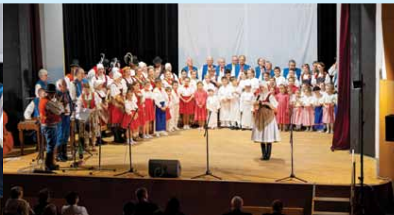
70. výročí založení souboru Světlovan – 11. 11. 2023