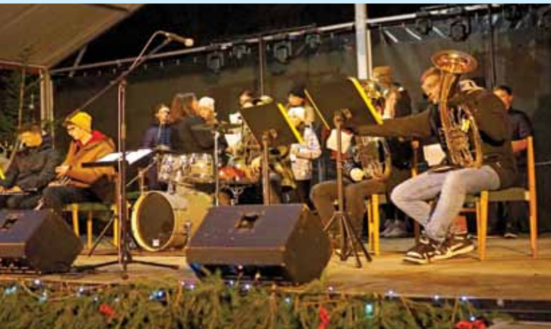
Vánoční jarmark – 15. - 16. 12. 2023