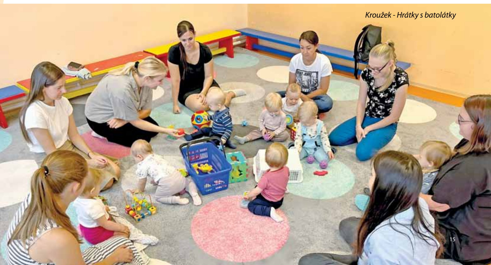
Kroužek - Hrátky s batolátky