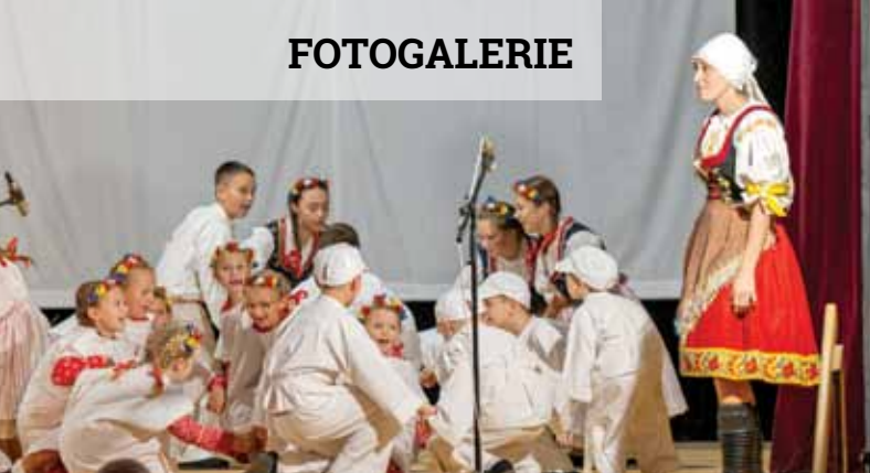
70. výročí založení souboru Světlovan – Pitíňánek, 11. 11. 2023