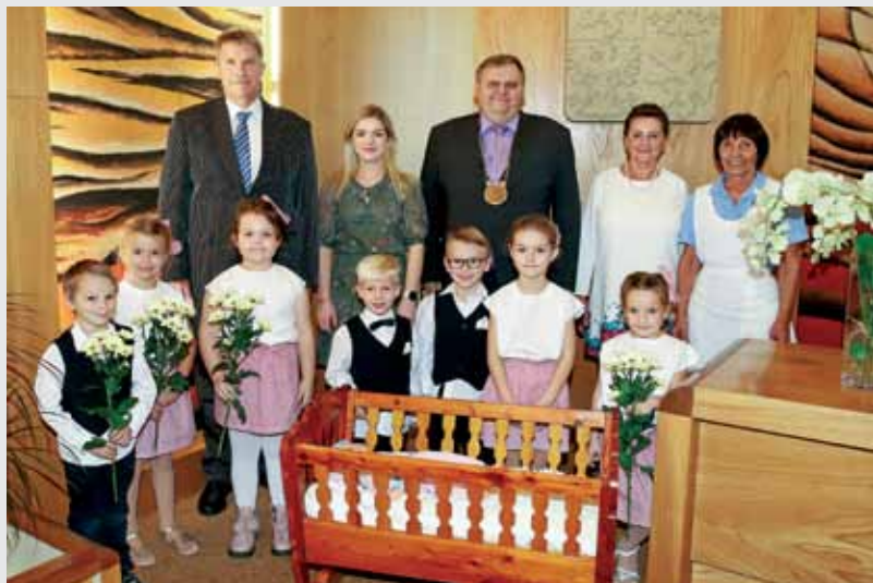
Vítání dětí do života na Městském úřadě v Bojkovicích – 14. 10. 2023