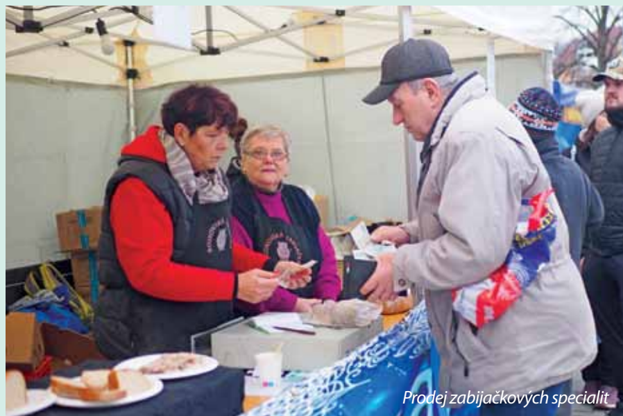
Prodej zabíjačkových specialit