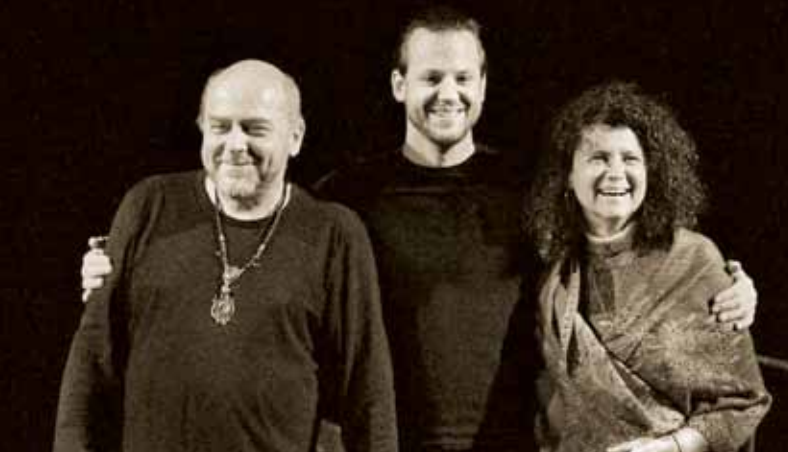
IVA BITTOVÁ TRIO, Klub Maják