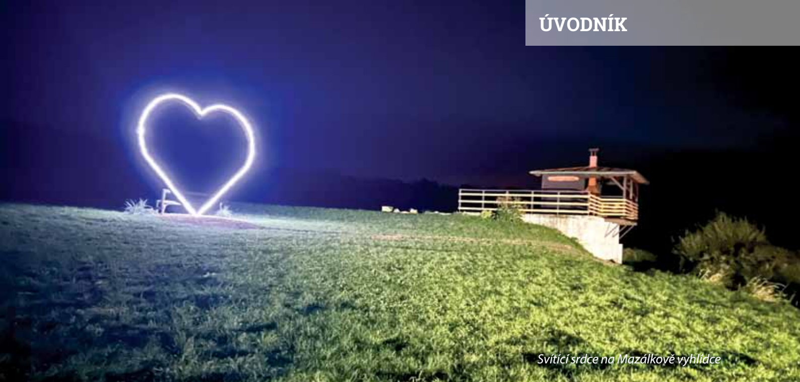
Svítilící srdce na Mazálkově vyhlídce