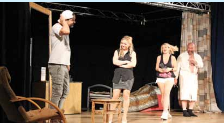
Tři v háji, Klub Maják