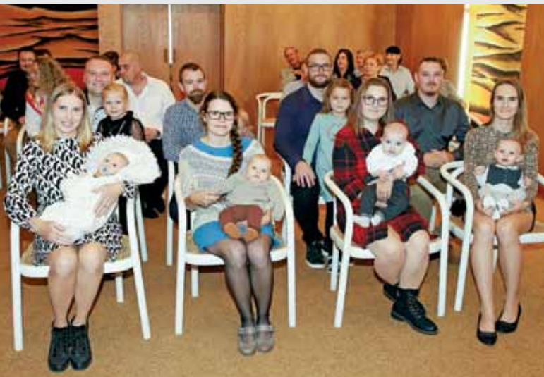
Vítání dětí do života na Městském úřadě v Bojkovicích – 14. 10. 2023