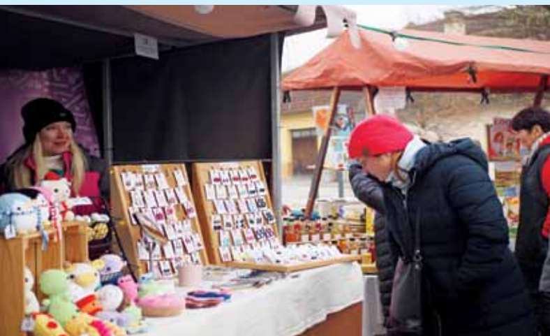
Vánoční jarmark – 15. - 16. 12. 2023