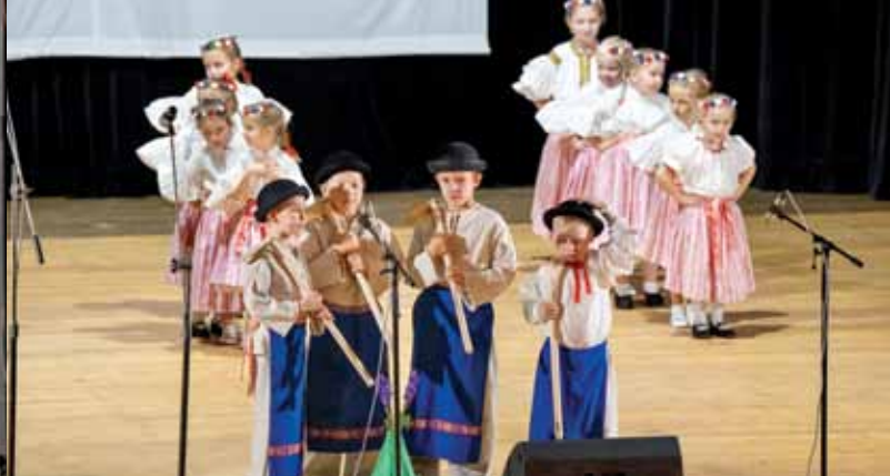
70. výročí založení souboru Světlovan – Dřínky, 11. 11. 2023