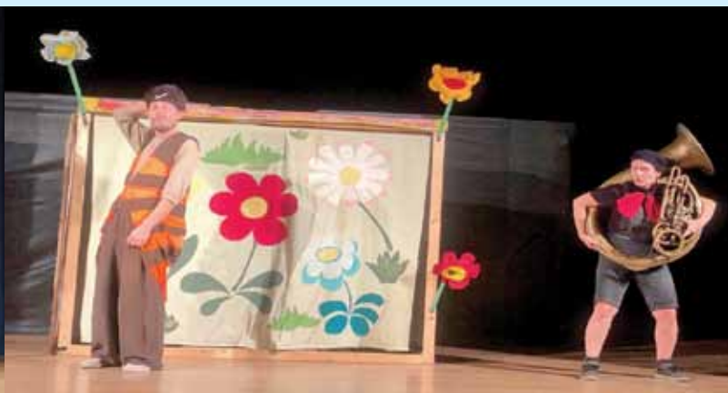
Ferda mravenec... pohádka v Klubu Maják