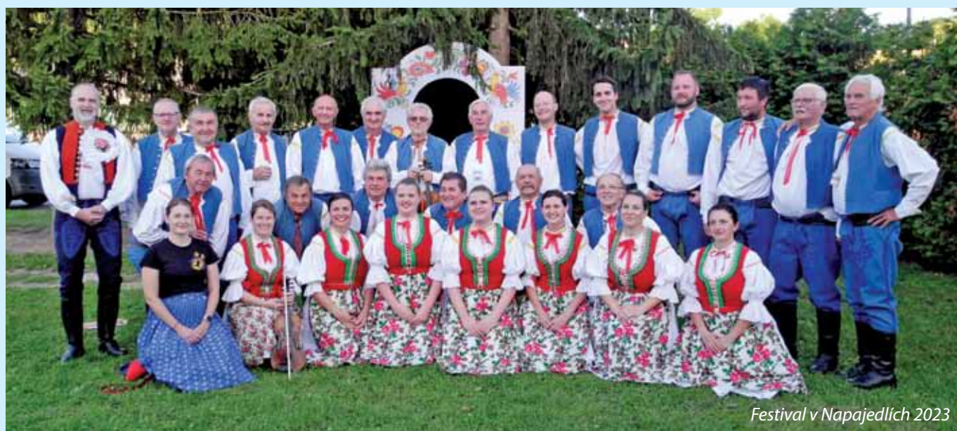
Festival v Napajedlích 2023