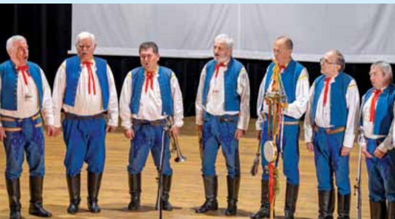
70. výročí založení souboru Světlovan – Vavřineček, 11. 11. 2023