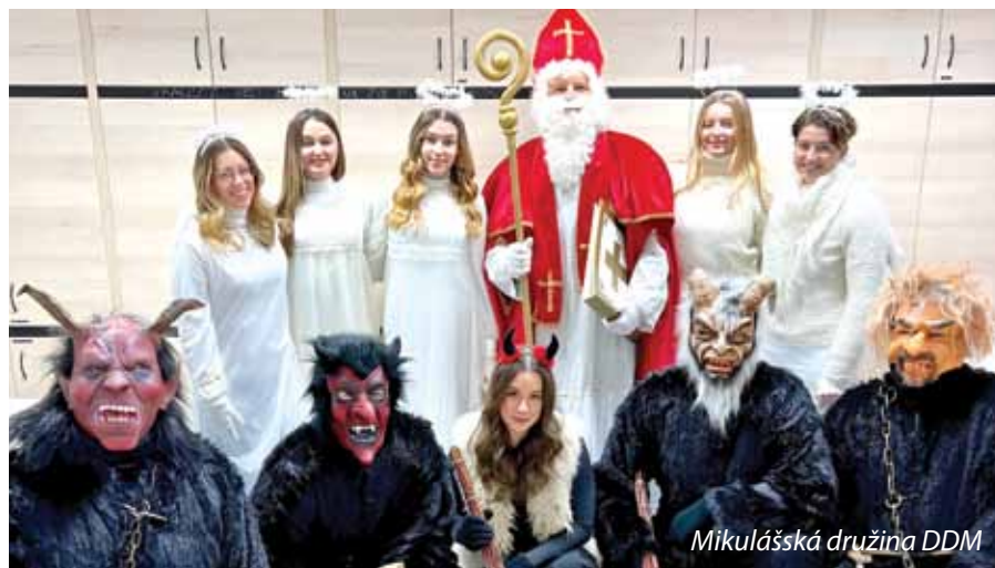
Mikulášská družina DDM

V měsíci říjnu a listopadu byla dopoledne vyplněna tradičním výukovým programem Vánoční keramické dílny, ve kterých se téměř 300 dětí seznamovalo se základními technikami práce s keramickou hlinou, s dekorováním výrobků pomocí glazur, ale i s tradicemi. A na konci této práce je krásný výrobek, kterým mohou potěšit své blízké.