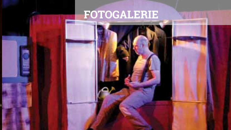
Tajemství staré skříně, Divadlo Matýsek