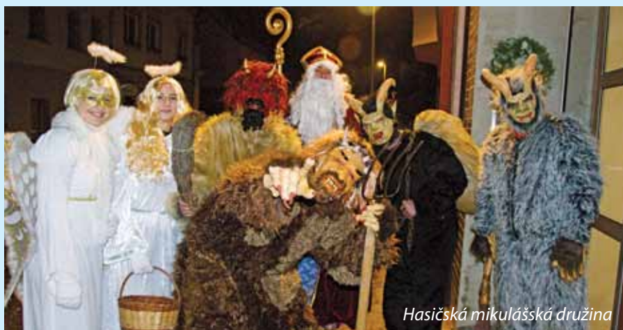
Hasičská mikulášská družina