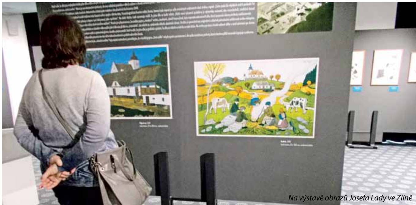
Na výstavě obrazů Josefa Lady ve Zlíně