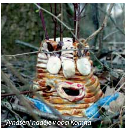
Vynášení naděje v obci Komňa