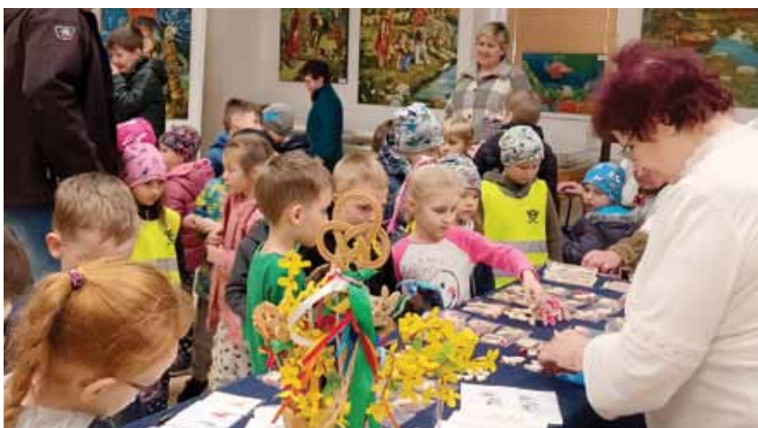
Velikonoční předvádění řemesel