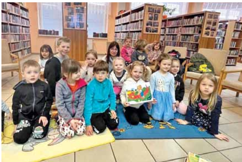
Rozfoukané pohádky s dětmi z MŠ Bojkovice

Další týden ve středu 22. března byla v dopoledních hodinách připravena akce pro nejmenší čtenáře a jejich rodiče, kteří se měli možnost přijít seznámit nejen s knížkami, ale také s prostředím knihov-