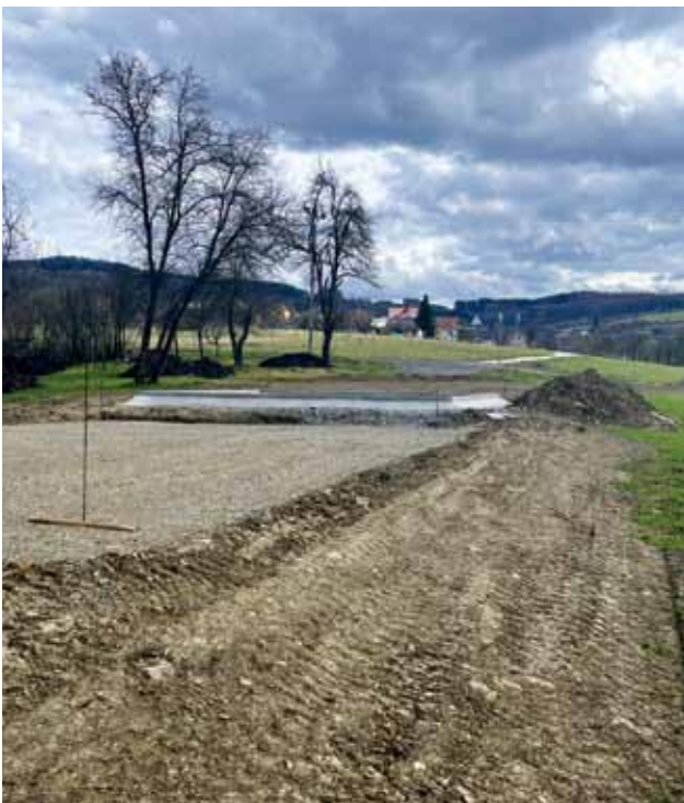
Práce na novém výletišti ve Bzové