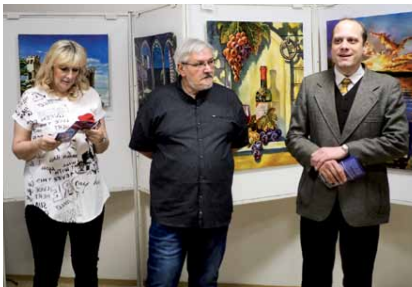
Vernisáž výstavy obrazů s názvem Barvosnění