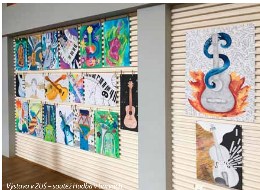
Výstava v ZUŠ – soutěž Hudba v barvách