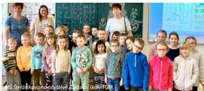
MŠ Štefánikova na návštěvě Základní školy TGM.