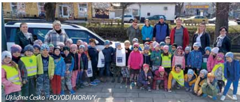
Uklidme Česko - POVODÍ MORAVY

V rámci akce „Uklidme Česko“ jsme navázali spolupráci s podnikem Povodí Moravy, závod Uherské Hradiště, odkud