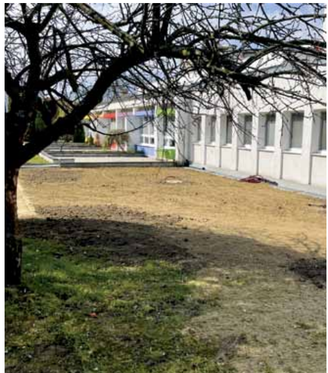
Rekonstrukce v mateřské škole