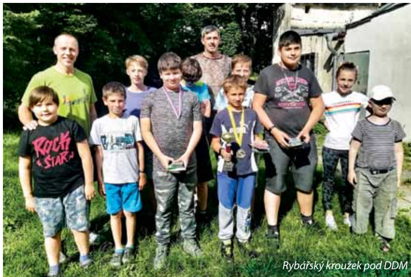
Rybářský kroužek pod DDM

Do revíru Olšava 3 A bylo vysazeno 920 kusů kapra obecného, 200 kusů lína obecného a 100 kusů candáta obecného v hodnotě celkem 107 762 Kč. Do odchovných potoků bylo vysazeno 70 000 kusů plůdku pstruha obecního v ceně 28 578 Kč. Celkově tedy byly vysazeny naším spolkem v roce 2022 násada ryb za 299 026 Kč. V roce 2022 členům našeho spolku bylo vydáno 451 povolenek k lovu ryb na všech revírech pstruhových i mimo pstruhových patřících do Moravského rybářského svazu. Celkově navštívili naši členové 84 revírů, na kterých při 7 630 vycházkách nalovili