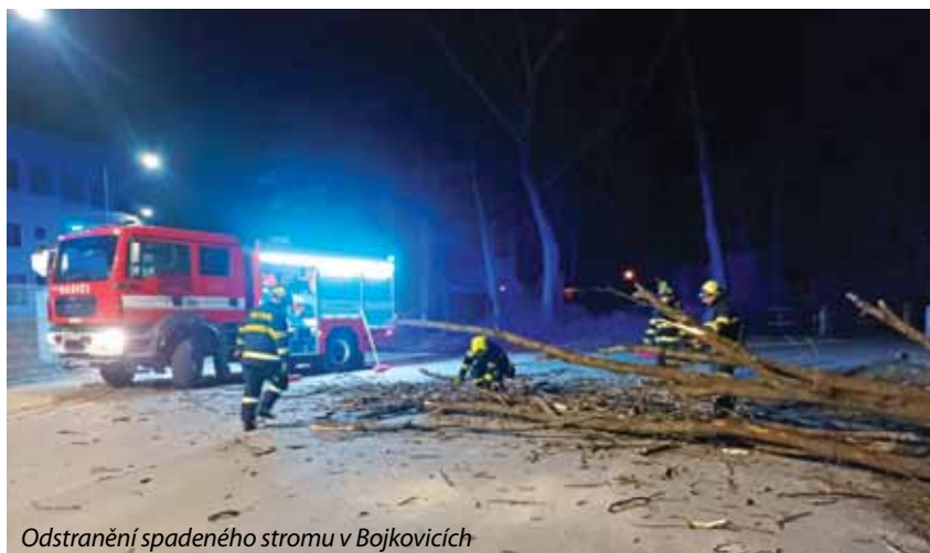
Odstranění spadlého stromu v Bojkovicích

Rok 2022 byl opět náročný jak co do počtu výjezdů, tak i do jejich technické ná-