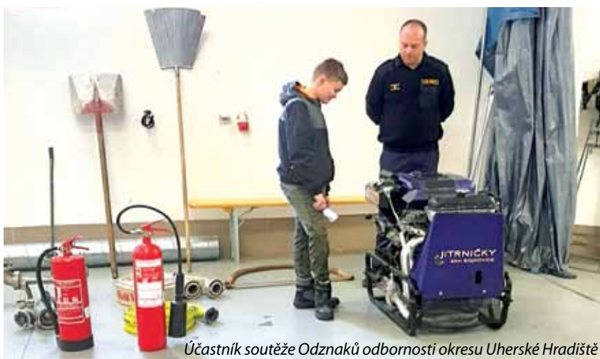
Účastník soutěže Odznaků odbornosti okresu Uherské Hradiště