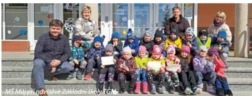
MŠ Máj při návštěvě Základní školy TGM