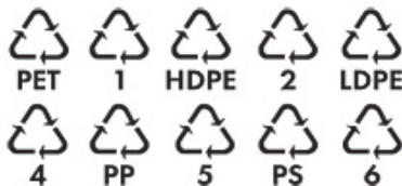
Kódové označení plastových odpadů.

Patří do žlutého kontejneru. V průměrné české popelnici zabírají nejvíc místa ze všech odpadů, proto je nejenom důležité jejich třídění, ale i sešlápnutí či zmačkání před vhozením do kontejneru.