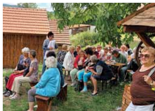
Prohlídka historického domku