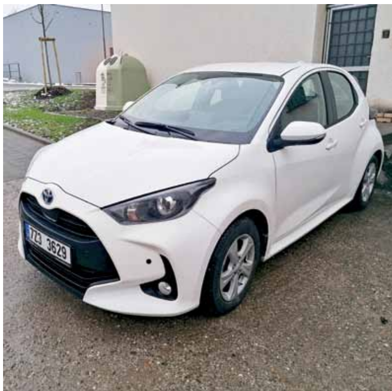
Nový automobil pro Sociální služby Města Bojkovice