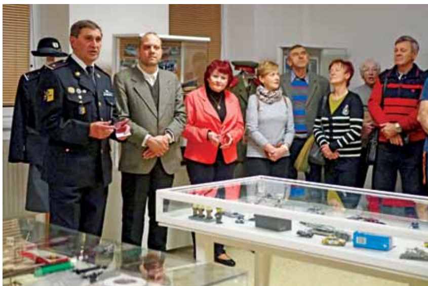
Vernisáž výstavy Policie doma a ve světě

V pátek 3. února byla vernisáž zahájena výstavou s názvem Policie doma i ve svě-