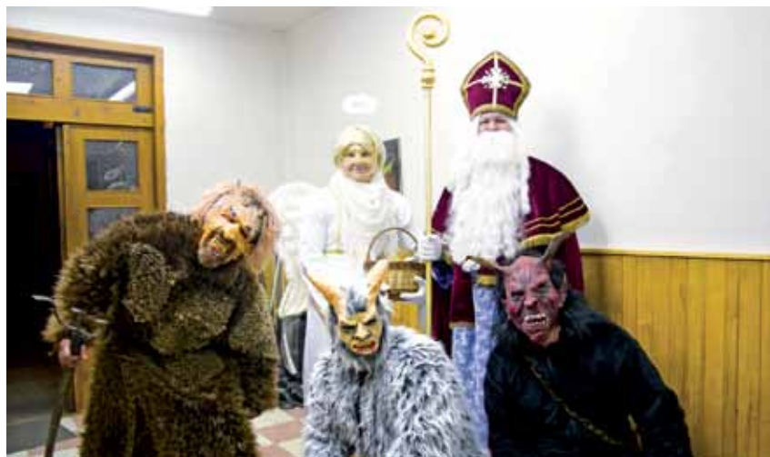
Hasičská mikulášská družina