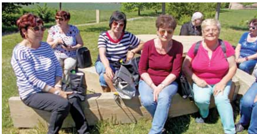
Zájezd Litovelské Pomoraví