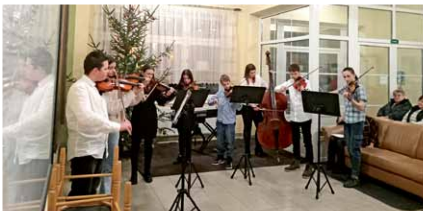
Vystoupení žáků ZUŠ