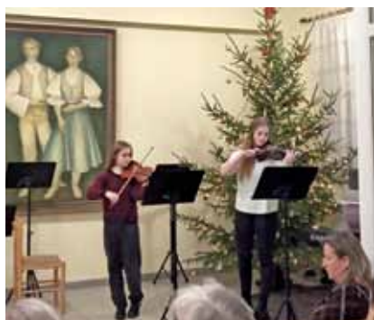
Vystoupení žáků ZUŠ