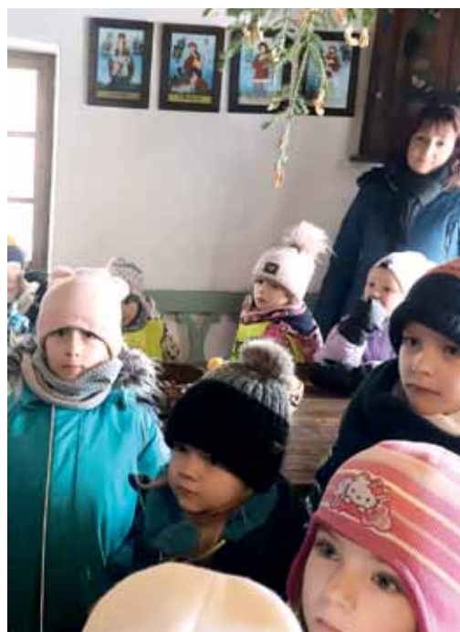
Návštěva dětí z MŠ v historickém domku